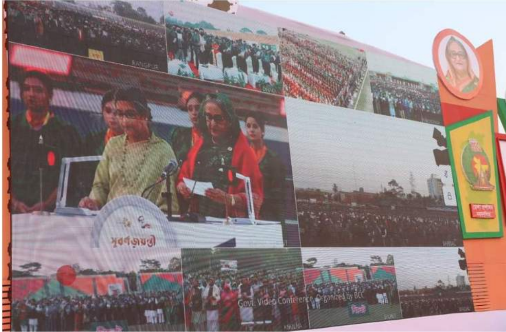
কেন্দ্রীয় শপথ অনুষ্ঠান; শপথ বাক্য পাঠ করাচ্ছেন মাননীয় প্রধানমন্ত্রী শেখ হাসিনা